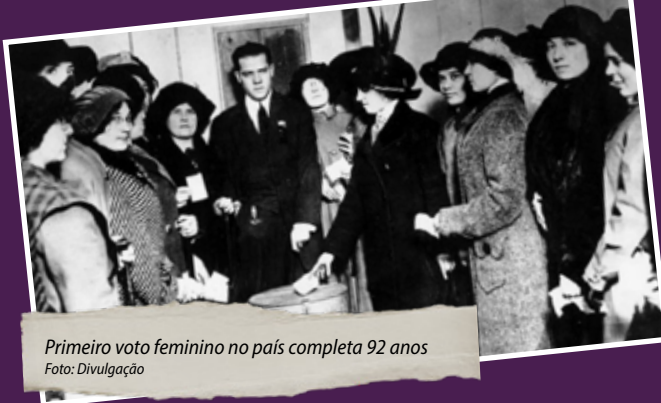
Primeiro voto feminino no país completa 92 anos

1827 – Meninas são autorizadas a frequentar a escola